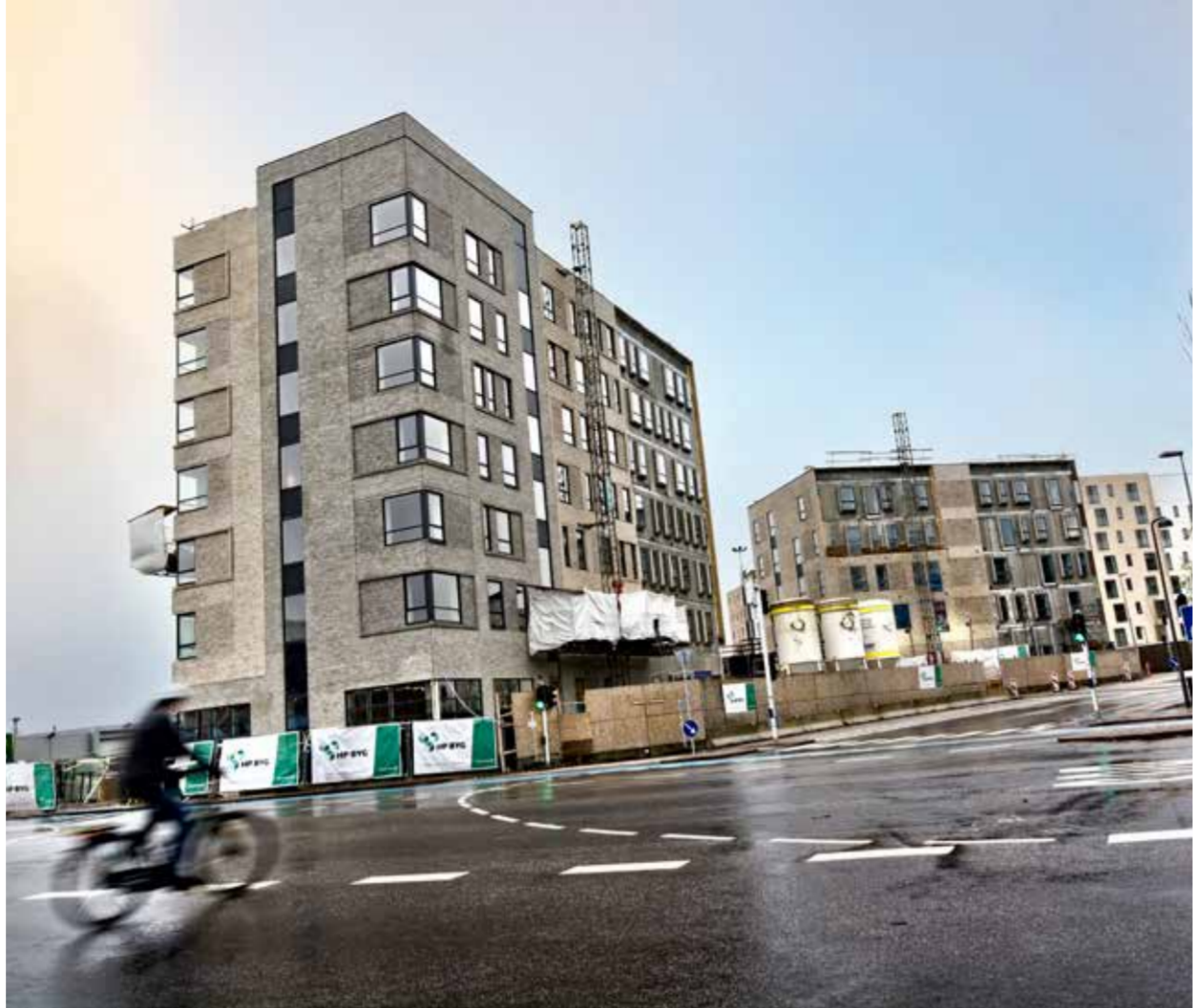
Det kommende B&B Hotels får en central placering i Aalborg på hjørnet af Jyllandsgade og Dag Hammerskjølds Gade – tæt ved John F. Kennedys Plads, byens nye Plusbus og Godsbanearbejdet. Projektet består af to bygninger, hvoraf den højeste – på syv etager – får hotellets lobby, restaurant med mere i stueetagen, mens de 101 værelser bliver fordelt over de resterende etager. Den anden bygning – på fem etager – kommer til at rumme 17 treværelses lejligheder. Bygherre på projektet er JG20 Invest P/S, mens arkitekt- og ingeniørarbejdet er udført af henholdsvis Bjørk & Maigård og INGENIØRNE. Det samlede byggeri skal stå færdigt til sommeren 2024.